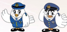
埼玉県警察マスコット 「ポボ美ちゃん」「ポボくん」